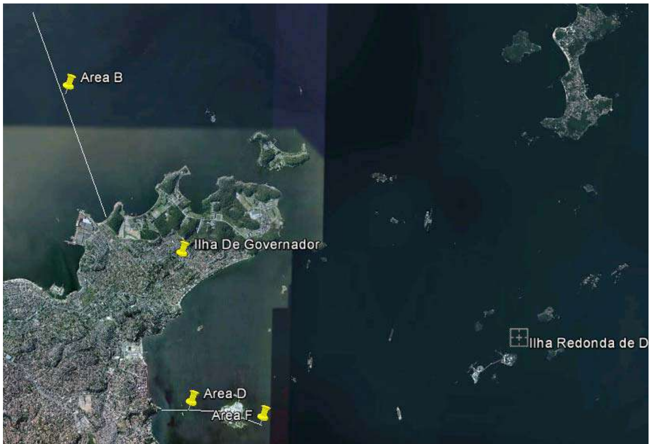
Guanabara Bay – Pipeline Route